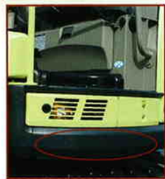
アンダーサイドプロテクター