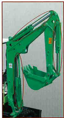
シリンダーガード